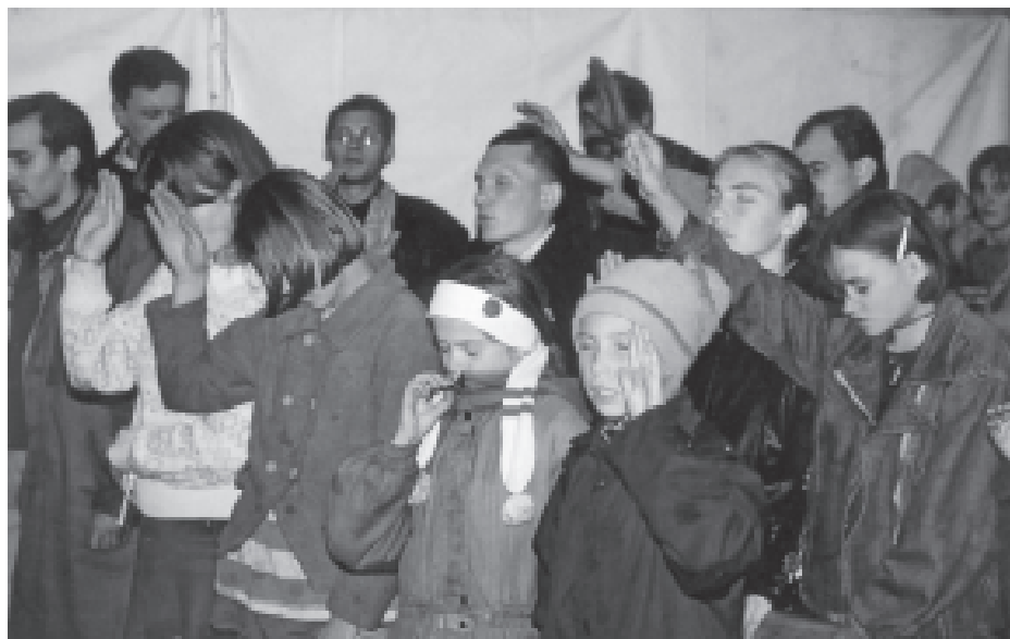
▲ När frälsningsinbjudan gick ut kom över trettio personer i olika åldrar fram och ville bli frälsta.

Uppdraget var klart; vi skulle nu inta Krasnaborsk, en liten by ca 9 mil utanför Uljanovsk. Vi provianterade och åkte dit. Man hade rest ett 200-mannatält och lånat in en ljudanläggning. Som vanligt var det mycket spännande första kvällen. Tältet fylldes av både äldre och yngre, och lovsångsgruppen drog upp tempot. När vi frågade mötesbesökarna om de hade sett någon svensk tidigare, så skakade alla på huvudet. Detta var dock inte så viktigt, det viktigaste var att göra Jesus känd, och när frälsningsinbjudan gick ut kom över trettio personer i olika åldrar fram och ville ta emot Jesus Kristus i sina hjärtan! Där det i årtionde efter årtionde proklamerats att det inte finns någon Gud, bryter evangelium igenom och