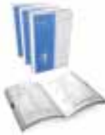
Praktisk lärjungaskola 15 kassetter + självstudiehäfte. Johannes Amritzer 448:-