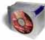
Månadens CD Johannes Amritzer 59:-/mån