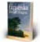
Den fariseiska församlingen Av Pascal Andréasson 130:-