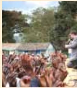
Omslagsbild Frälsningsinbjudan på Migori Signs&Wonders Festival i Kenya