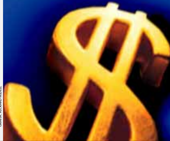
GRAFIK: RICHARD WIDDEL

Ge lite (eller mycket) regelbundet utöver ditt tionde, t ex. som månads-givare i Mission SOS, så blir det en hel del pengar på sikt.